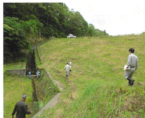
図-2 現地パトロール Fig.2 local patrol