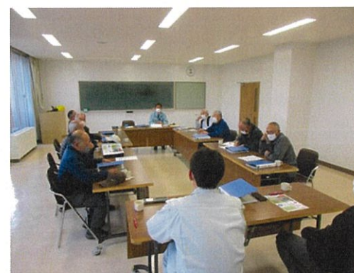
図-3 管理者向け研修会 Fig.3 manager training session